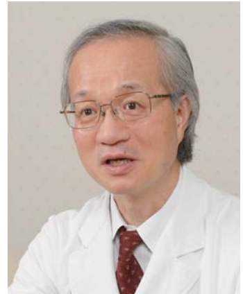
日本医科大学特任教授 日本呼吸ケア・リハビリテーション理事長

診療時間は、毎週水曜日の午後2時から4時30分となっております。計50人程度の患者さんを診療していく予定です。都内でこのような外来を開設するのは初めてのことであり、周辺の医療機関からも期待がよせられています。